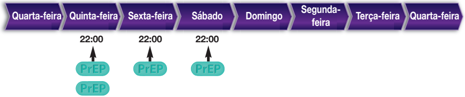
Figura 2. Exemplo de um cronograma da dosagem intermitente se você tiver relações sexuais várias vezes dentro de um período.

1 comprimido da PrEP 24 horas* depois da dose dupla 1 comprimido da PrEP 48 horas* depois dos primeiros 2 = total de 2 comprimidos depois do sexo *2 horas antes ou depois do horário planejado também funciona